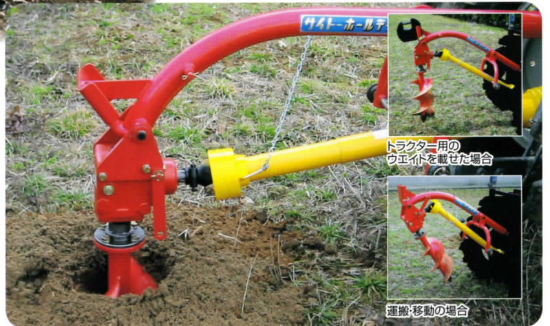
地面が固く、さざりが悪い場合はトラクタ用のウェイトを載せてください。(※本機にはついていません。)