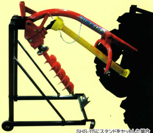
SHS-15にスタンドをセットした場合

トラクタへの着脱が一人で簡単。 そのまま収納・移動ができる。 大変便利なスタンドです。