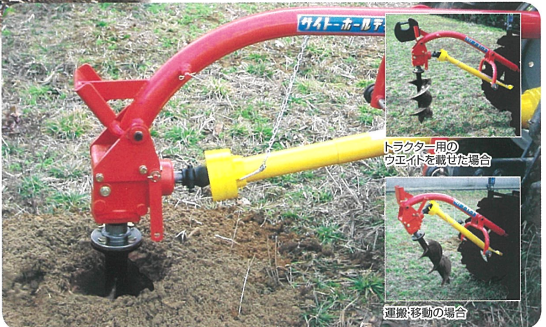
トラクタ用のウエイトを載せた場合